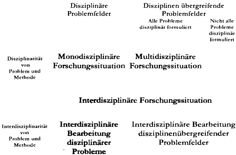
Abbildung 3: Formen wissenschaftlicher Tätigkeit

Die Häufigkeit dieser Kombination von Problemformulierung im disziplinübergreifenden Bezug einerseits mit der Interdisziplinarität von Problem und Methode andererseits haben wir in unseren Untersuchungen verwendet und dabei die in Tabelle 1 angezeigten Häufigkeiten gefunden.