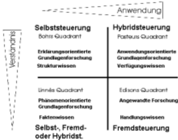
Abbildung 2: Quadrantenmodell der Forschungstypen

aber wesentlich durch die Konkurrenz von Erklärungsansätzen vorangebracht. Daher wäre es sinnvoll, neue Ansätze ohne strikte Begutachtung zu fördern.